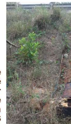
La parcelle aménagée a été végétalisée par plantation de vétiver en novembre 2016