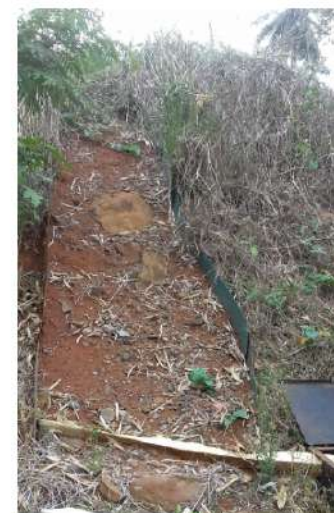
La parcelle témoin est maintenue à nue